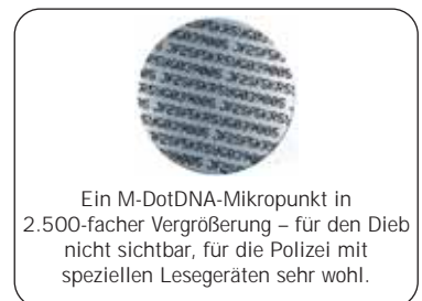
Ein M-DotDNA-Mikropunkt in 2.500-facher Vergrößerung – für den Dieb nicht sichtbar, für die Polizei mit speziellen Lesegeräten sehr wohl.

In Wohnungen, die mit M-DotDNA gesichert sind, ist die Einbruchgefährdung nachweislich um 50 Prozent zurückgegangen. Warnaufkleber an Türen und Fenstern weisen auf das Sicherungssystem hin und machen diese Haushalte für Diebe unattraktiv, sodass Einbrecher Wohnungen oder Häuser, die mit M-DotDNA geschützt sind, eher meiden.